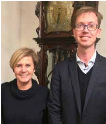
Kulturminister Mette Bock og verdensmester Rasmus Ørskov...

Rasmus Ørskov deltog i sin egenskab af Verdensmester i Svæveflyvning sammen med andre danske topidrætsfolk.